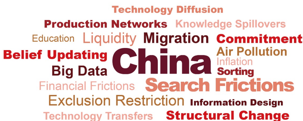
图 2: 中国院校及研究机构在“PHBS 50”经济学核心期刊上发表论文中高频关键词(2025) 研究议题; 数据来源: 北京大学汇丰商学院

型与方法方面,受到学者较高关注的包括:因子模型(Factor Model)、分位数回归(Quantile Regression)、异质性(Heterogeneity)、主成分分析(Principal Component Analysis)、空间自回归模型(Spatial Autoregressive Model)等。