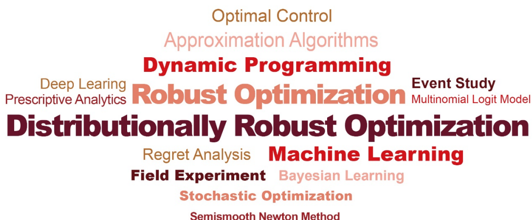
图 9: 中国院校及研究机构在“PHBS 50”运营管理核心期刊上发表论文中高频关键词 (2025) 研究方法; 数据来源: 北京大学汇丰商学院