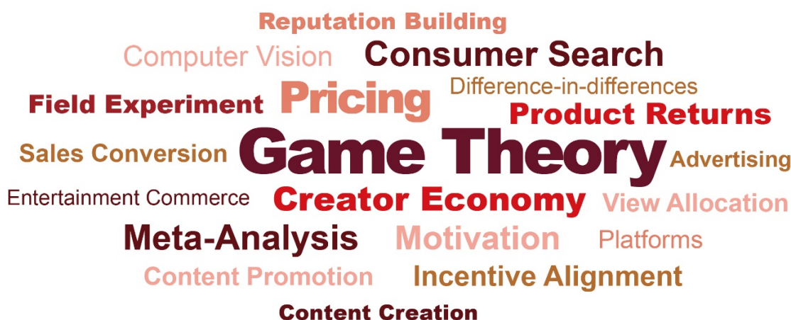
图 6：中国院校及研究机构在“PHBS 50”市场营销核心期刊上发表论文中高频关键词（2025）