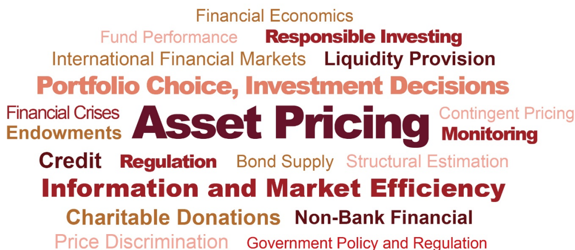
图 4：中国院校及研究机构在“PHBS 50”金融学核心期刊上发表论文中高频关键词 (2025)

2025 年，资产定价 (Asset Pricing) 是中国院校及研究机构在“PHBS 50”金融学核心期刊上参与发表的论文中高频的关键词。此外，学者对资产组合选择与投资决策 (Portfolio Choice, Investment Decisions)、信息与市场效率 (Information and Market Efficiency)、国际金融市场 (International Financial Markets)、非银行金融 (Non-Bank Financial) 等议题的关注较高。