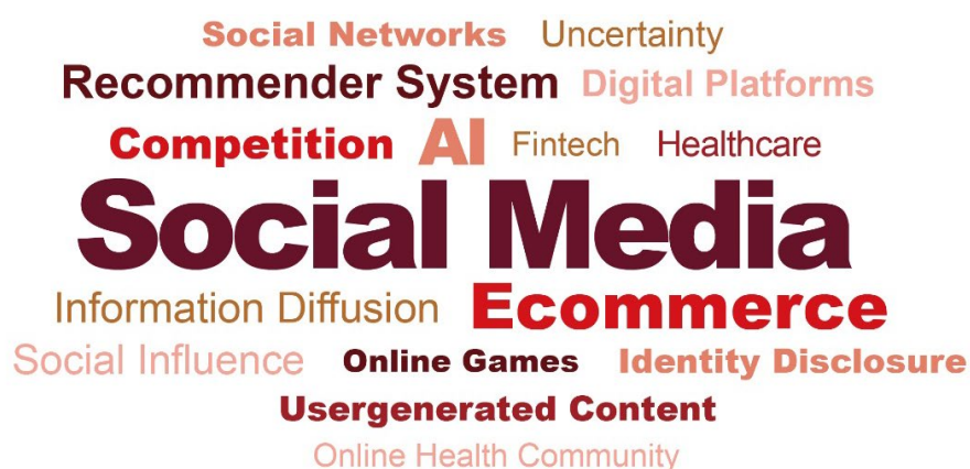
图 10: 中国院校及研究机构在“PHBS 50” 信息系统核心期刊上发表论文中高频关键词 (2025)

2025 年, 中国院校及研究机构在“PHBS 50” 信息系统核心期刊上参与发表的论文中, 高频研究议题包括: 社交媒体 (Social Media)、人工智能 (AI)、电子商务 (Ecommerce)、推荐系统 (Recommender System) 等。至于研究方法, 随机田野实验 (Randomized Field Experiment)、异质性 (Heterogeneity)、统计推断 (Statistical Inference) 等受到学者较多关注。