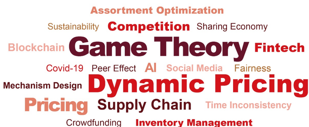
图 8: 中国院校及研究机构在“PHBS 50”运营管理核心期刊上发表论文中高频关键词 (2025) 研究议题; 数据来源: 北京大学汇丰商学院

2025 年, 中国院校及研究机构在“PHBS 50”运营管理核心期刊上参与发表的论文中, 高频研究议题包括: 动态定价 (Dynamic Pricing)、博弈论 (Game Theory)、供应链 (Supply Chain)、定价 (Pricing)、竞争 (Competition) 等。至于研究方法, 分布鲁棒优化 (Distributionally Robust Optimization)、鲁棒优化 (Robust Optimization)、机器学习 (Machine Learning)、动态规划 (Dynamic Programming) 等受到学者较多关注。