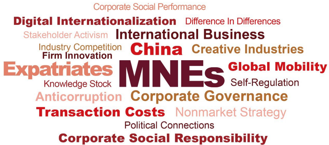
图 12：中国院校及研究机构在“PHBS 50”战略管理核心期刊上发表论文中高频关键词（2025）