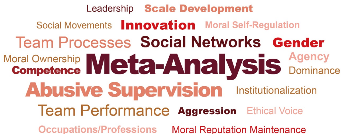
图 7: 中国院校及研究机构在“PHBS 50”管理学核心期刊上发表论文中高频关键词 (2025)

(Gender)、量表开发 (Scale Development)、团队绩效 (Team Performance)、团队过程 (Team Processes) 等同样受到学者较多关注。