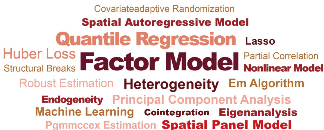
图 3: 中国院校及研究机构在“PHBS 50”经济学核心期刊上发表论文中高频关键词(2025) 计量方法; 数据来源: 北京大学汇丰商学院